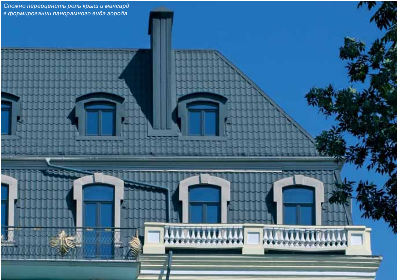
Сложно переоценить роль крыш и мансард в формировании панорамного вида города

Есть и другие, сугубо практические соображения: наклонные окна пропускают на 40 % больше сол-